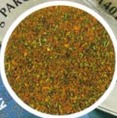
Krautwürzung PARGO, Art.-Nr. 140147